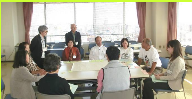
第2回「ボランティアを愉しもう！」 をテーマにしたワークショップの様子

講義でのワークショップの際に、グループ討議の時間があり、参加したみなさんの意見を聞くことができたので有意義でした。