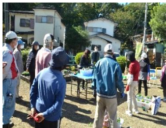
講師を招いて実習

などの効果が期待でき、継続実施することによって「安全で安心の街づくり」対策に大きく貢献することができます。