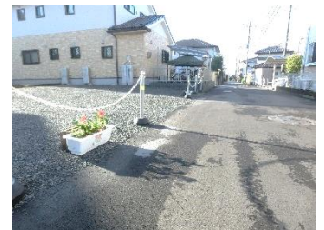
プランターを配置

子どもたちと一緒に花植えたプランター 80 個を町内の通学路沿いに配置し、更に子どもたちから募集した「花いっぱい運動ポスター」の展示会を開催するなどの活動は地域住民の関心を大いに高める事になりました。