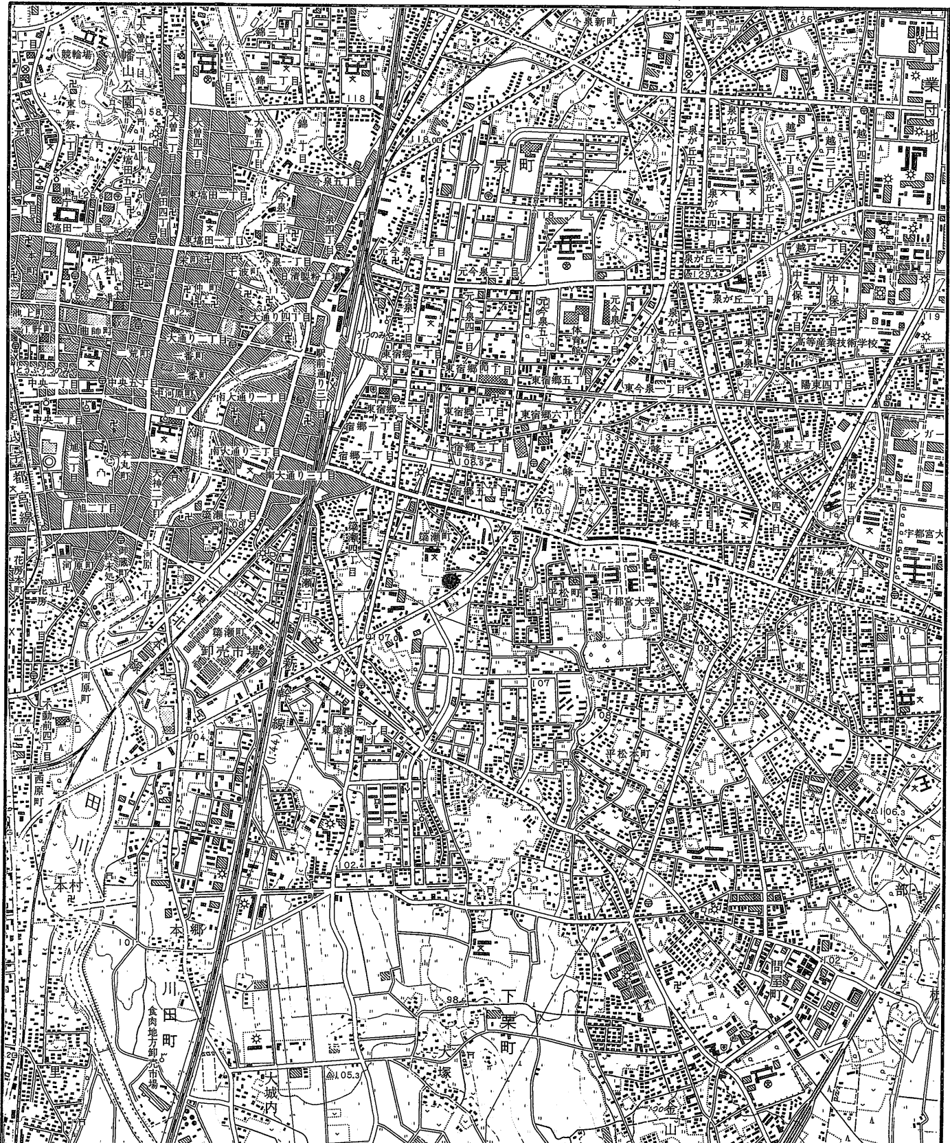
案内図 縮尺 1:25,000 ● 調査地 (国土地理院発行, 1/2.5万地形図「宇都宮東部」を使用)