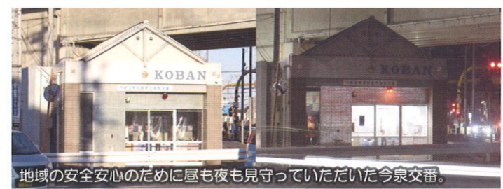
地域の安全安心のために昼も夜も見守っていただいた今泉交番。