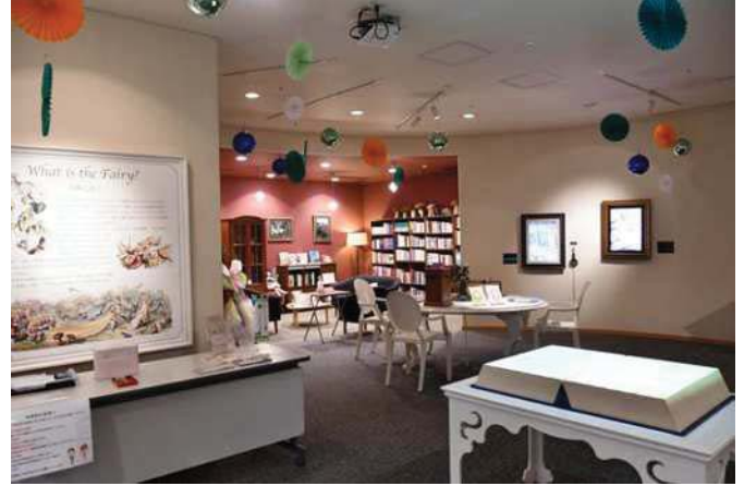
▲妖精ミュージアム