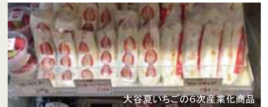
大谷夏いちごの6次産業化商品