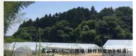
大谷夏いちごの圃場(耕作放棄地を解消)