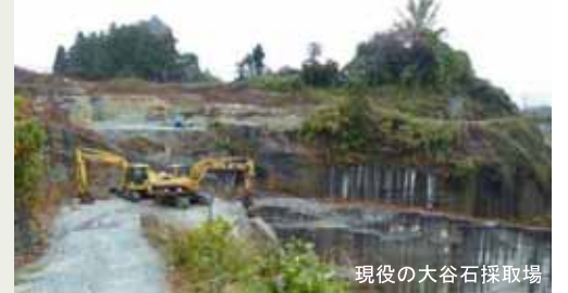
現役の大谷石採取場