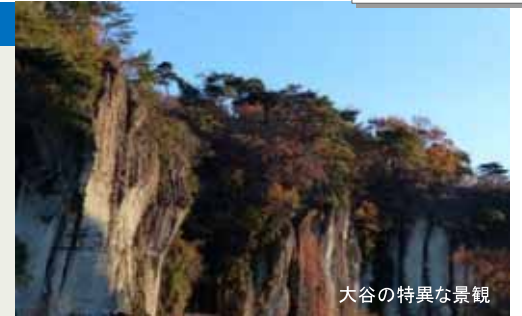
大谷の特異な景観