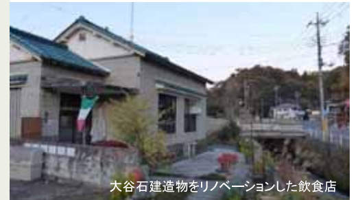
大谷石建造物をリノベーションした飲食店