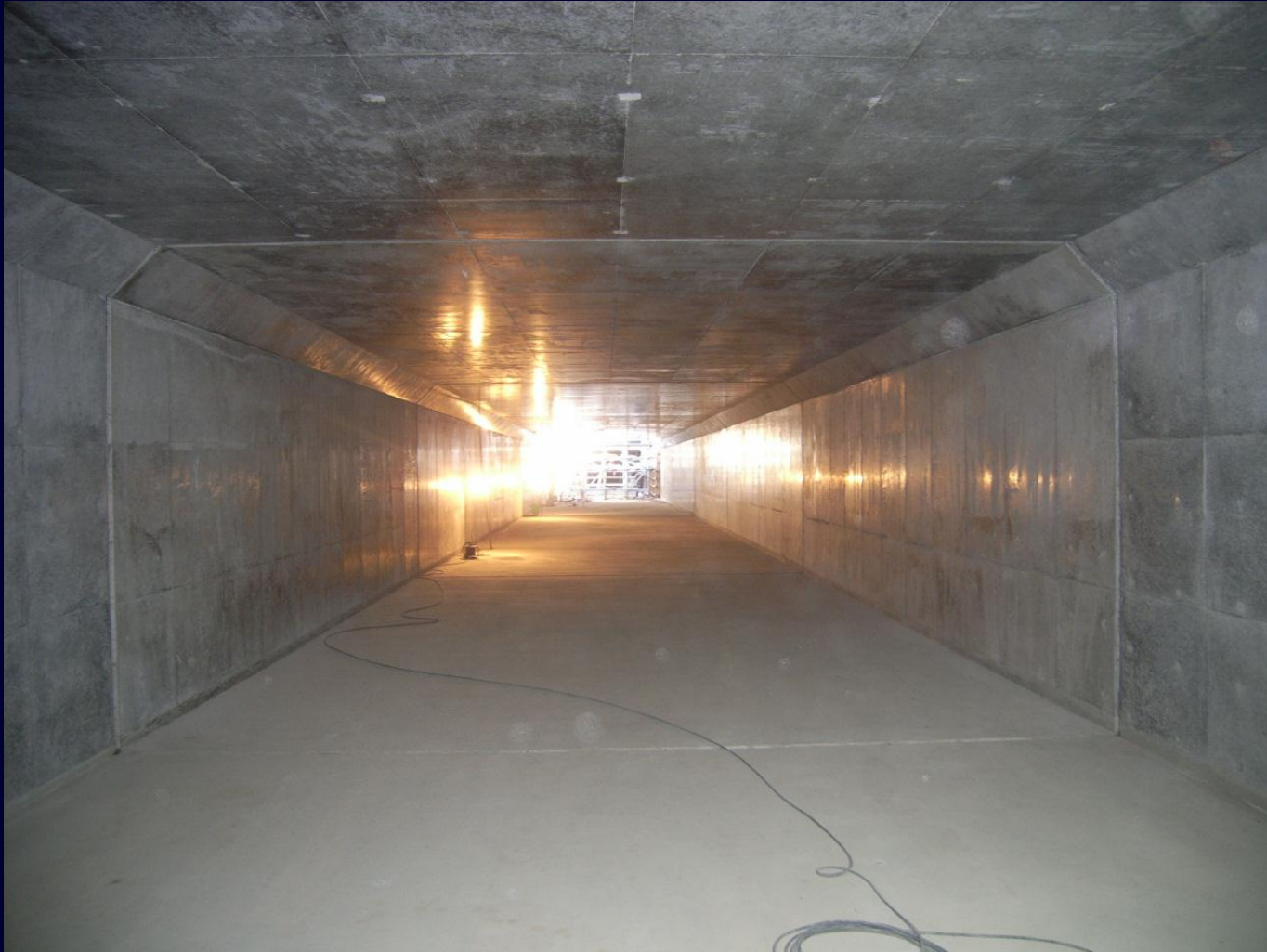
準用河川越戸川バイパス