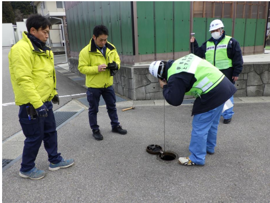
音聴棒による漏水調査