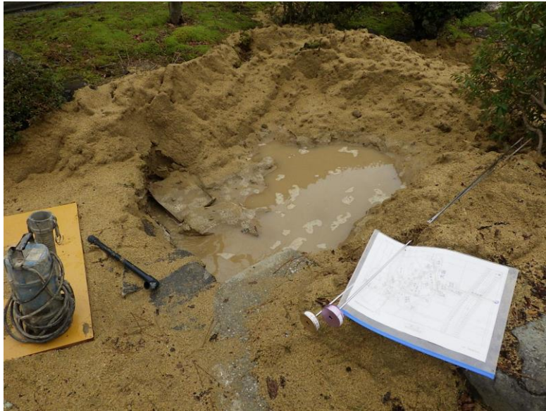
メータBOX付近の漏水