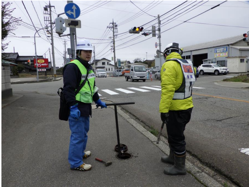
通水作業（仕切弁操作）