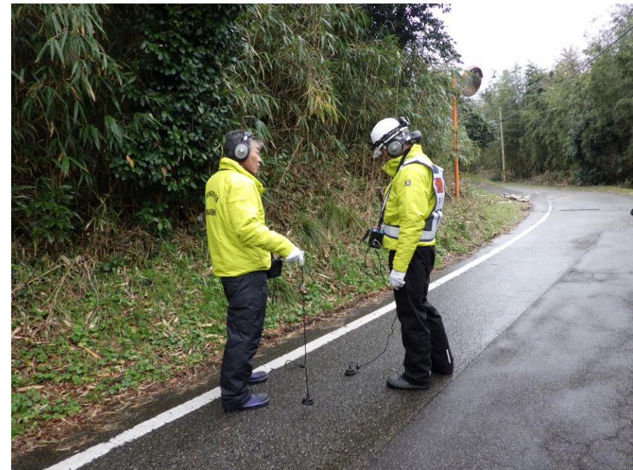
漏水探知機による漏水調査