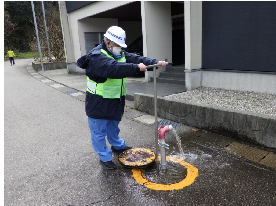
通水確認作業（消火栓放水による洗管）