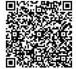
市ホームページ (カラー版)