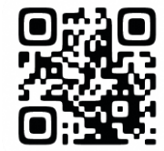
宇都宮市SDGs人づくり プラットフォームHP