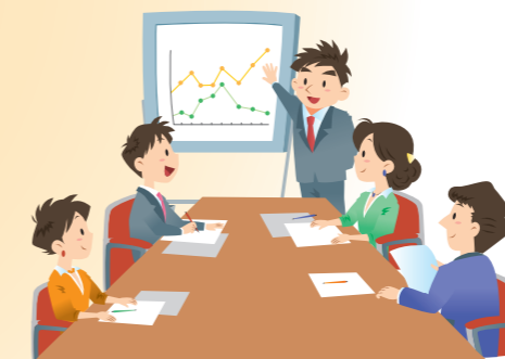
計画の見直し・検討