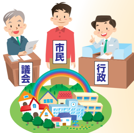
自治を担う3者で実施

まちづくりに必要な施策・事業をみなさんと一緒に計画・改善しながら市政運営していきます。