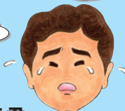
まちづくり したろう君