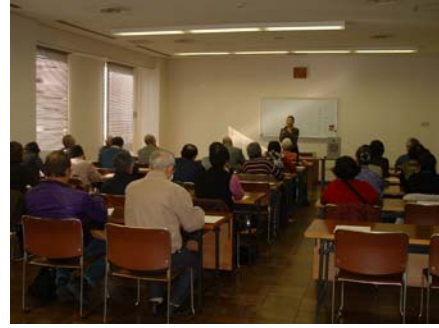
講師のあたたかな語り口になごむ会場