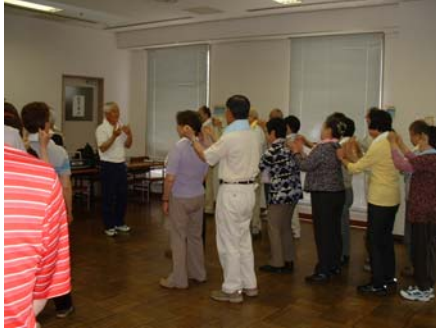
大好評のレクリエーション