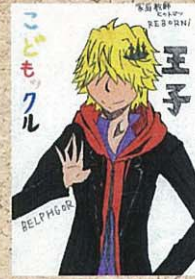
陽西中 2年生 P.N なべちゃんさん