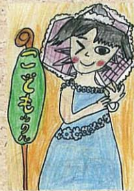
今泉小 1年生 P.N あつくさん