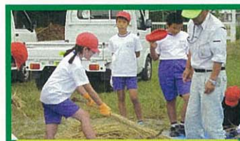
5年 おいしいお米を作ろう