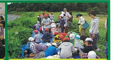
4年 山田川の自然を調べよう