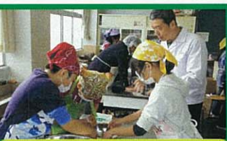
6年 みそ作りをしよう