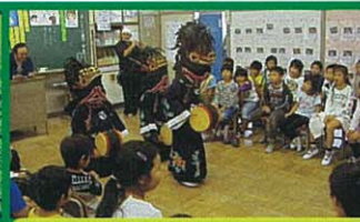
3年 伝統文化を知ろう