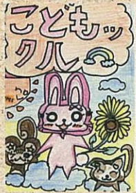
上戸祭小 2年生 鎌田 賀帆さん

ここで紹介できなかったイラストも、ホームページに載せているよ！ 子ども情報センターホームページ ( http://www.3.city.utsunomiya.tochigi.jp/kids/ ) へアクセスしてね！たのしいイラストまってるよ(〇^)/