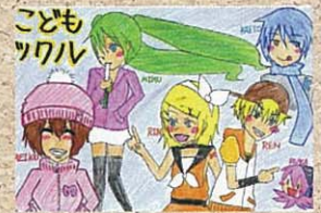
陽北中 3年生 P.N BANANAICHIGOさん