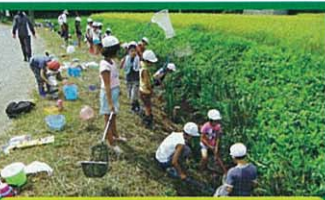
2年 いきものとなかよし