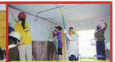
プール更衣室の補修