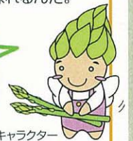
アスパラリンのイメージキャラクター「りんちゃん」