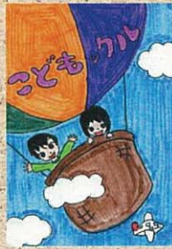
姿川第一小 5年生 P.N 青いうさぎさん