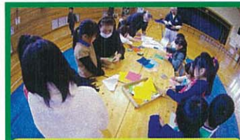
1年 昔遊びをしよう

を合言葉に ○よく考えがんばりぬく子ども ○すなおで思いやりのある子ども ○健康で明るい子ども の育成に努めています