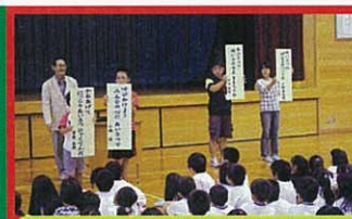
あいさつ標語の表彰