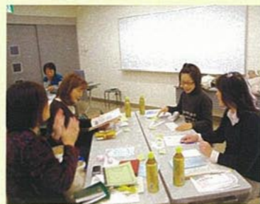
昨年度の編集会議の様子

参加希望の方は、直接または電話で生涯学習課家庭教育グループまでご連絡ください。詳しくはホームページまたはお問い合わせください。