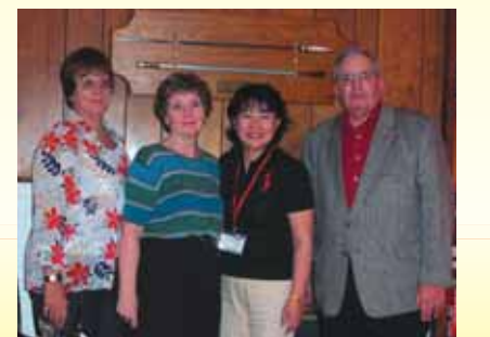
ホームステイ先にて(右から2人目)

今後は、自分のできる範囲内でこの研修で学んだことを地域に貢献していきたいと思っています。