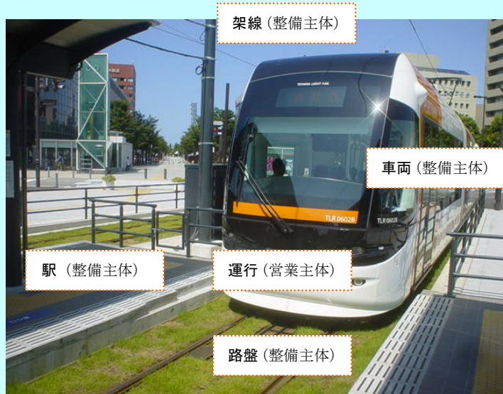
図：上下分離方式の一般的な役割

上下分離方式は、営業主体（上）と整備主体（下）がそれぞれの役割を分担する方式です。