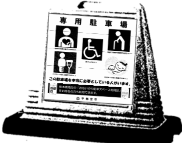
表示板を取り付けた状態