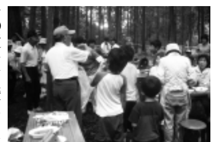
「横川地区子どもとふれあう会」による親子体験活動（平成18年度交付団体）