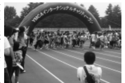
「とちぎYMCA」によるチャリティーラン（平成18年度交付団体）

（応募団体が審査員に事業内容の説明）で、「スタート支援コース」「ステップアップ支援コース」ごとに助成先を決定します。助成額は、助成対象経費の2分の1以内です。