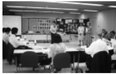
審査会（応募団体による事業内容の説明）