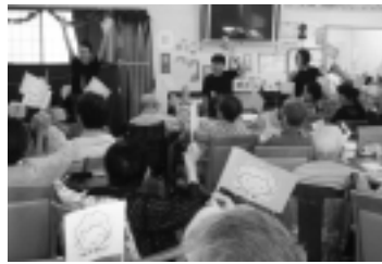
「はっぴいまざー」による福祉施設での活動（平成18年度交付団体）