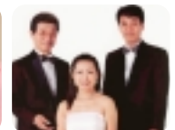
ロス・インディオス

◎対面朗読サービスのご利用を 新聞・チラシ・書籍などご希望の印刷物を、対面にて朗読するサービスを行っています。▽日時 4月11・25日(水)午後1時～3時、4月14・28日(土)午前10時～正午▽会場 市総合福祉センター3階(中央1丁目)▽対象 視覚障害者▽申込 不要。☎ ボランティアセンター ☎(636)1285