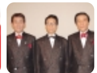
鶴岡雅義と東京ロマンチカ