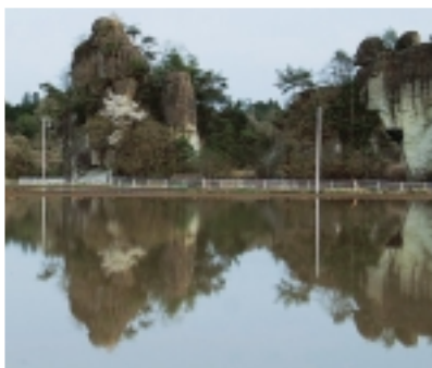
北側の水田から見た越路岩