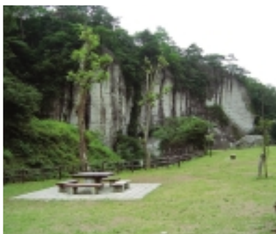
大谷景観公園から見た御止山