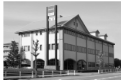
平成18年度まちなみ景観賞大賞

▽応募方法 市役所1階総合案内、上河内・河内地域自治センター(旧町役場)、各区市民センター・出張所、岡本・田原事務所、各地域コミュニティセンター・生涯学習センター・図書館などに置いてあるチラシの中の応募はがきに必要な事項(建物などの名称・所在地、応募者の住所・氏名・電話番号、応募の理由)を書き、8月31日までに、直