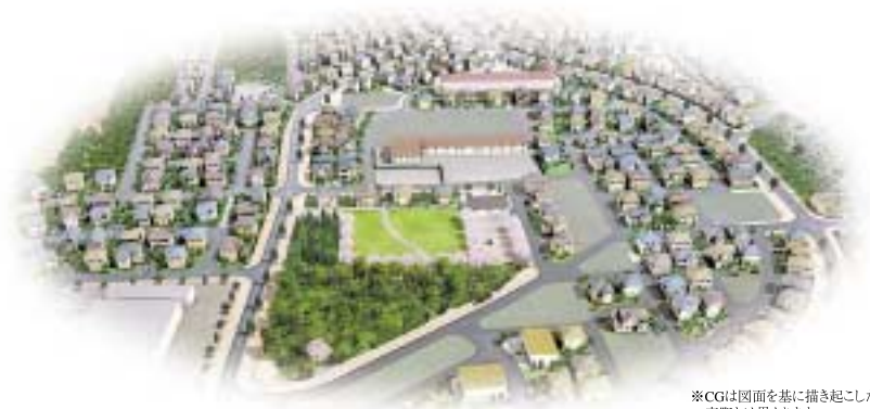
※CGは図面を基に描き起こしたもので 実際とは異なります。

人と緑のシンフォニー MIZUHONO MIDORI no SATO みずほの 緑の郷