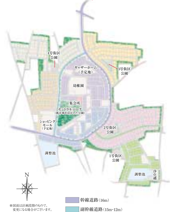
※図面は計画段階のもので、 変更になる場合がございます。