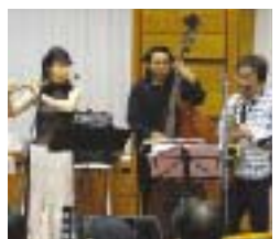
昨年のコンサートの様子

日時 6月11日(水)午前9時20分～9時45分(9時10分開場・議会開会午前10時)。 会場 市役所 議会棟6階議場。 出演 ORQUESTA de ごじゃる! 定員 先着120人(入場無料) 申込 不要。当日、会場へ。満席の場合は立ち見になることもあります。 議会事務局 ☎(632)2611