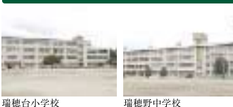
瑞穂台小学校 瑞穂野中学校

分譲地内に計画されたキッズスペース。既設の幼稚園。至近には小学校と中学校。 充実した教育施設