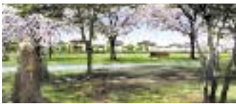
※CGは図面を基に描き起こしたもので実際とは異なります。