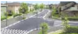
※CGは図面を基に描き起こしたもので実際とは異なります。

街路や公園、そして幹線道路からフットパスへと続くアプローチの隅々にまで、優しさの街づくりは細やかな心配りのもとに、設計されています。