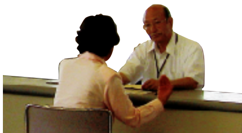
みやシニア活動センター

各地域の老人クラブに、直接お申し込みください。連絡先が分からない場合は、宇都宮市老人クラブ連合会1(634)4950へ。