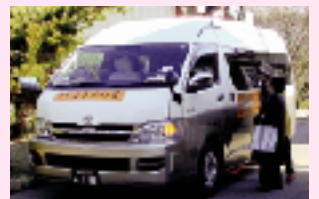
今年1月から清原地区で運行を始めた地域の足「清原さきかけ号」

助成券を交付します（一年度につき1回助成）。 助成券を、指定のバス営業所・乗車券販売所に持参し、乗車券を購入してください。 申請方法 申請・助成券交付窓口 市役所2階高齢福祉課（D8窓口）、市役所1階保健と福祉の総合相談（B1窓口）、各地域自治センター、富屋・平石・姿川地区市民センター、その他の地区市民センター、出張所で申請の場合は、後日、