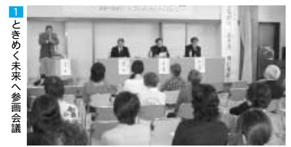
1 ときめく未来へ参画会議

基本目標 男女が共に生き生きと暮らせる環境の整備。 主な事業 延長保育など多様な保育サービスの提供、男女共同参画が進んでいる事業所の表彰、再就職支援セミナーの開催など。 成果 就労環境の整備に取り組んだ結果、30代前半女性の労働力率が向上。