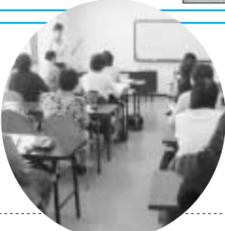
4 女性リーダー ステップアップ講座