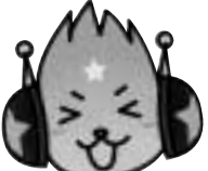
市男女共同参画マスコット「キラピカ」