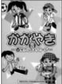
3 市男女共同参画教育参考資料「かがやき」