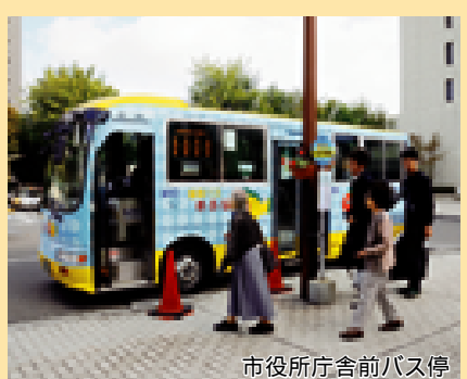
市役所庁舎前バス停

本文中に費用などの記載がないものは、原則として無料 HP ホームページ Eメール アドレス