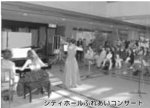
シティホールふれあいコンサート