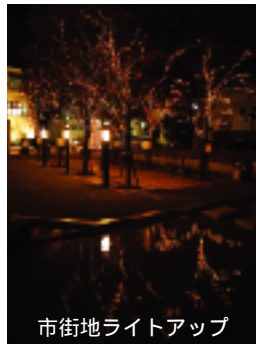
市街地ライトアップ