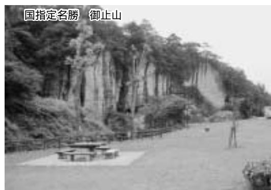
国指定名勝 御止山