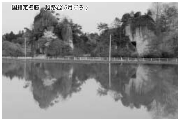
国指定名勝 越路岩(5月ごろ)