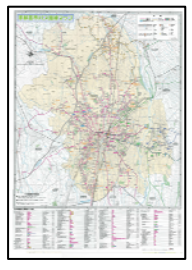
▶宇都宮市バス路線マップ