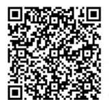
アットとちぎ 携帯 バーコード

市内のバスの時刻は「アットとちぎ」で調べることができます。 http://www.atochigi.ne.jp/bus/