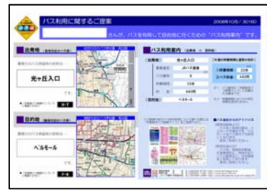
▶バス利用に関するご提案

② バス利用に関するご提案・バスマップ 一人ひとりに合わせて作成したご自宅から目的地までのバス利用案内とバス路線マップです。