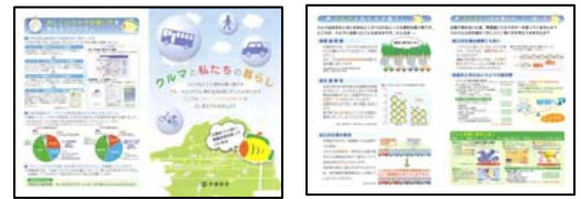
▶クルマと私たちの暮らし

② バス利用に関するご提案・バスマップ 一人ひとりに合わせて作成したご自宅から目的地までのバス利用案内とバス路線マップです。