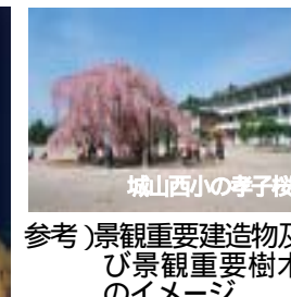
参考)景観重要建造物及び景観重要樹木のイメージ