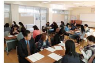
家庭や地域の教育力の向上