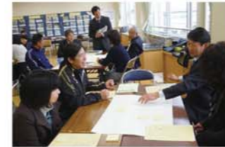
活力ある学校づくりに参画