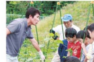
地域の教育力を生かした学校教育の充実