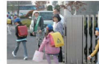
児童生徒の健全育成・安全確保に参画