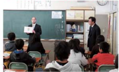
4・3・2制の小中一貫教育カリキュラム