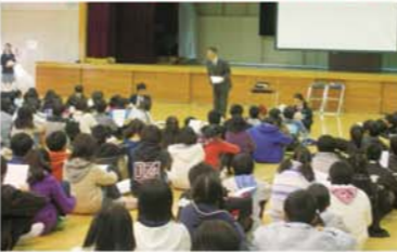
小学校6年生の進学先中学校訪問

中学校教員や生徒による学校生活の説明や、部活動の見学などにより、進学への期待を高め不安解消を図っています。