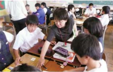
小中学校教員の相互乗り入れ授業

小学校6年生が中学校教員の授業を、中学校1年生が出身小学校教員の参画する授業を受けています。