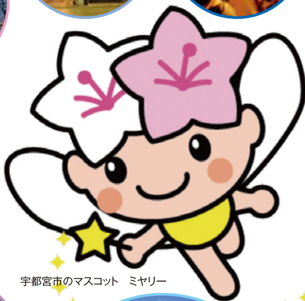
宇都宮市のマスコット ミヤリー