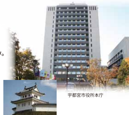
宇都宮市役所本庁