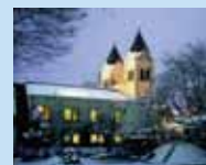
大谷石造りのカトリック松ヶ峰教会

宇都宮の特産物として有名なものが大谷石です。大谷石は、約2千万年前に火山活動でできた凝灰岩で、軽く加工がしやすく耐久性も優れているため、様々な建造物に使われています。大谷石採掘場跡の巨大地下空間や、自然の岩壁に彫られた高さ27mの平和観音などがあります。