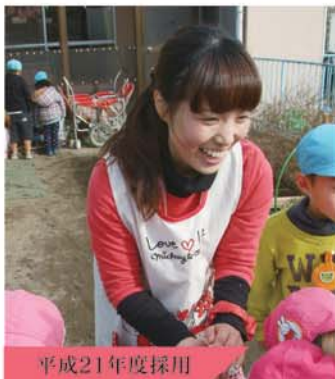
平成21年度採用 子ども部 保育課 東浦保育園