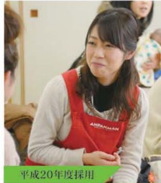
平成20年度採用 市民まちづくり部 富屋地区市民センター