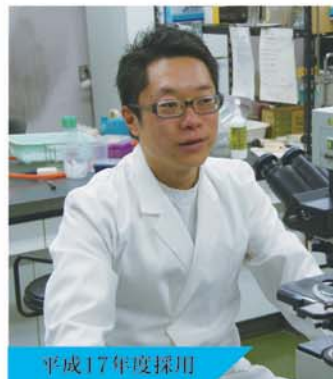
平成17年度採用 保健福祉部 食肉衛生検査所