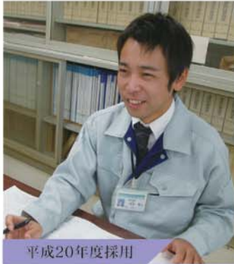
平成20年度採用 都市整備部 建築指導課