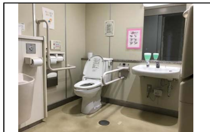
画像2（トイレと手すりの位置がわかるよう撮影）