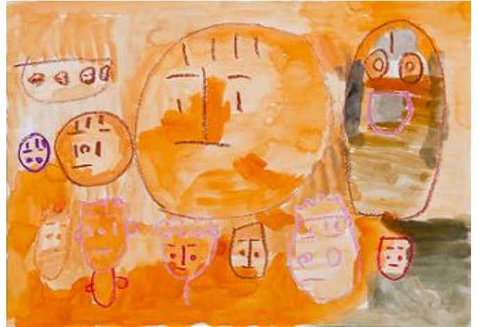
「ぼくのかぞく」／高塩 竜二