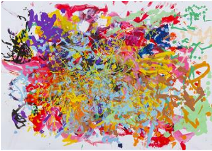
「カラフル」／金子 智浩