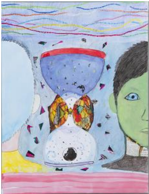
「ミステリーなダンジョン」/S. T