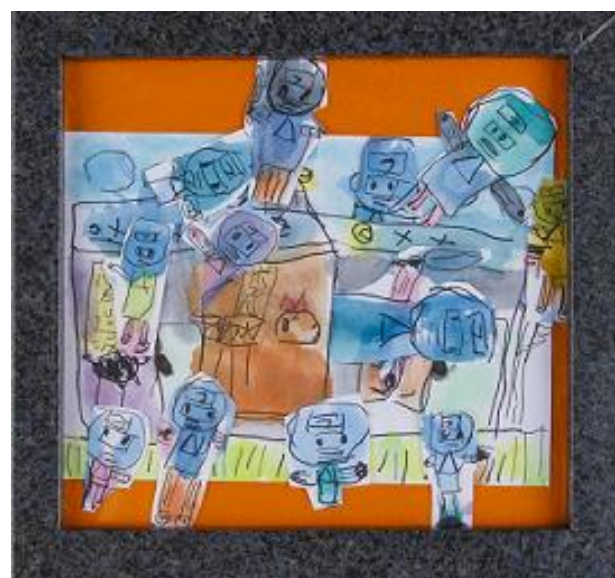
「忍者屋敷」/茂呂澤 康平