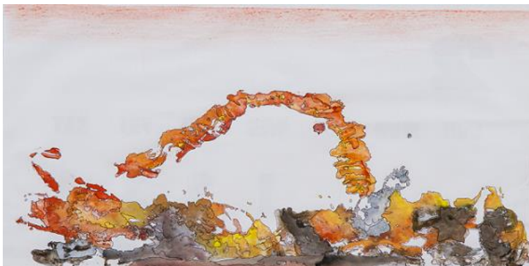
「Red Sun Part I」/K. H