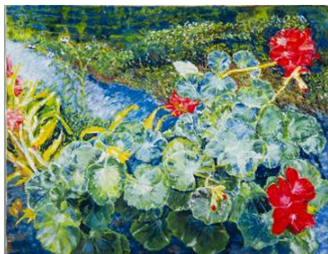
「朝日のゼラニウム」／浜田 勝利