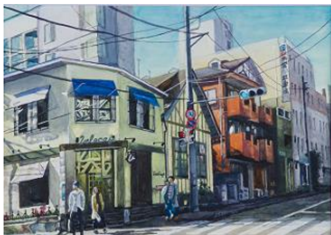
「カフェのある街角」／大沼 清