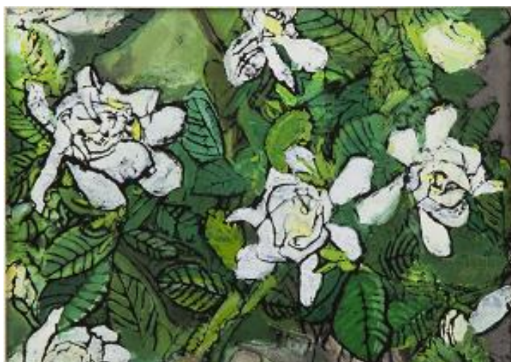
「クチナシの花」/三部 快