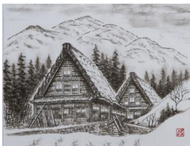
「白川郷の萱ぶき集落」／和田 次弘