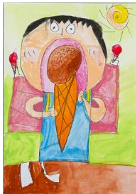
「アイスクリーム-校外学習の思い出-」 野島 光