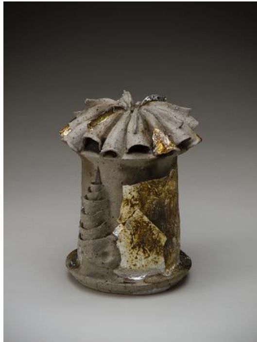
「語りえぬもの」/石原 健司