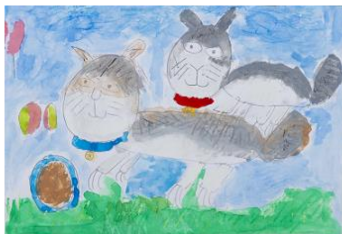
「ハッピーとラッキー」/吉原 諒