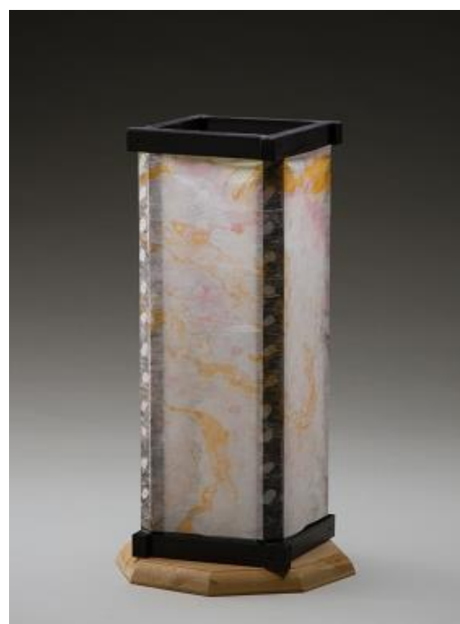
「わたしのきもち」/赤羽 孝子