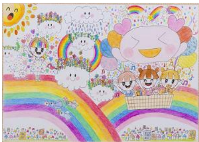
「みつごちゃんのにじのせかい」/趙 順南