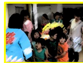
ここほっとまつり