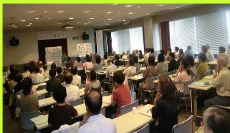
講演会の様子（満員御礼でした）