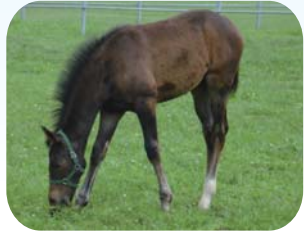
JRA「競走馬総合研究所」

広々とした牧場、「松風荘」の庭園にはヤシオツツジ・しだれ桜・モミジに加えて松の巨木がそそり立つ。馬が走り回る風景や、蹄鉄を装蹄する音がこたまし心を和ませる。