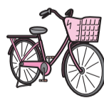
รถจักรยาน