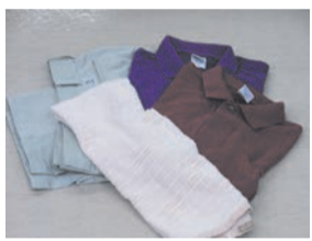
ประเภทเสื้อผ้า เสื้อเชิ้ต ผ้าเช็ดตัว เป็นต้น ประเภท ผ้า

○ขอให้ ล้างน้ำแล้วพับใส่ถุงพลาสติกที่มองเห็นข้างในก็ได้ ○ของที่ต้องเก็บไว้ในโรงเก็บของถ้าเปียกน้ำ อาจจะทำให้เชื้อราขึ้นได้ กรุณา อย่าทิ้งในวันที่ฝนตก