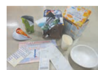
กระดาษที่จะนำมาใช้อีกไม่ได้ (กระดาษป้องกันน้ำให้ห่อๆ กระดาษไว้อุดความร้อน เป็นต้น)