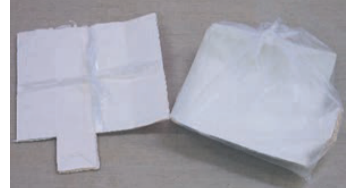
กล่องใส่ลม กล่องนำหวาน ที่ข้างในเป็นสีขาว แพ็คกระดาษที่ข้างในเป็นสีขาว)

○ล้างน้ำครั้งหนึ่ง และเปิดฝาทำให้แบนวางให้แห้งก่อนแล้วผูกด้วยเชือกเป็นตัวบวก+หรือจะใส่ถุงพลาสติกที่มองเห็นข้างในก็ได้