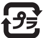
เครื่องหมายที่เป็นสัญลักษณ์