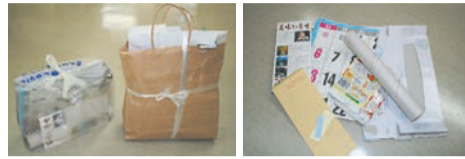
ประเภท นิตยสาร และกระดาษเอกสาร