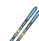
ไม้ สก๊ เป็นต้น

(ระวัง!) กรีนพาคโมบะรา กรีนพาคเซ็นเตอร์ ชิโมะทะอะรา (จำนวนปริมาณที่จะไปทิ้งเองได้ให้ดูด้านหลังประกอบ)