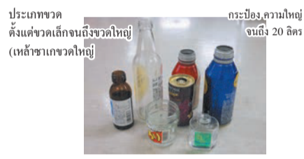
ประเภทขวด ตั้งแต่ขวดเล็กจนถึงขวดใหญ่ (เหล้าขาวขวดใหญ่)