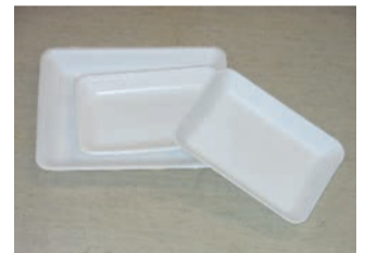
เนื้อ และ ปลา ใส่อาหารต่าง ๆ ต้องไม่มีลวดลายหรือสีอื่น เป็นถาด สีขาว ที่ใส่อาหาร

○ขอให้แยกส่วนที่เปื้อนและสกปรกออกก่อนใส่ถุงพลาสติกที่มองเห็นข้างในก็ได้