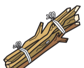
กิ่งไม้ที่ตัด เป็นต้น

ขอให้ใส่ถุงพลาสติกใส หรือ ที่มองเห็นข้างใน