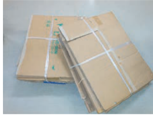
ลังกระดาษ

(ด้านที่ตัดขวางลักษณะขึ้นลงเป็นลูกคลื่น)