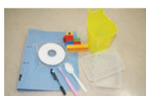
สิ้นค้าที่ทำด้วยพลาสติก