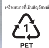
ขวดพลาสติกที่มีเครื่องหมายให้แยกแยะ โดยเฉพาะขวดพลาสติกที่ใส่เครื่องปรุงรสชาติ

○เปิดฝาขวดและแกะสลากข้างขวดออกก่อน ไม่ต้องทำให้แบน ใส่ถุงพลาสติกที่มองเห็นข้างในก็ได้