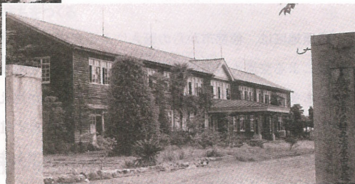
兵舎を利用した清原中学校