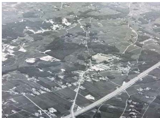
昭和50年代の国本地区