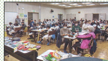
ビンゴ大会の様子