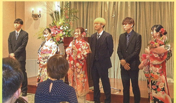
実施委員の皆さん