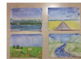
「おるり分教室作品」