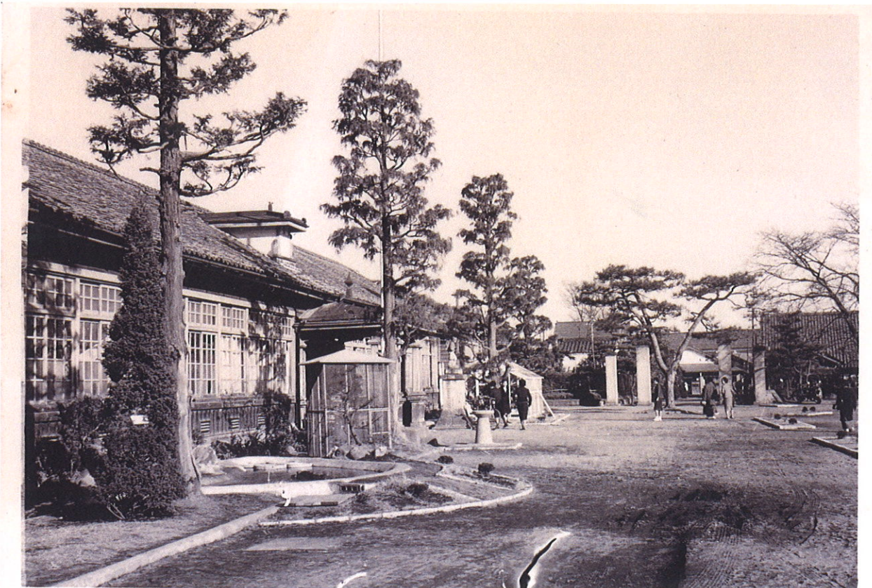
昭和38年 創立90周年の冬