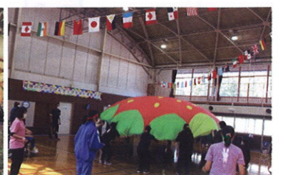
「本校運動会いちご会ダンス」