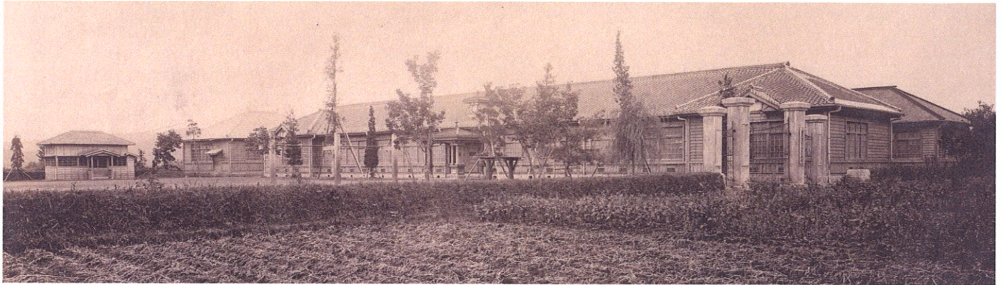
校舎全景 大正3年3月 前年12月落成

編集/発行 河内地区まちづくり協議会 〒329-1105 宇都宮市中岡本町3221-4 028-671-3202