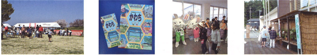
地域ビジョンに基づいたプログラムの一例