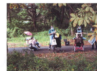
「やしお学級校外学習」

岡本特別支援学校は、病気により地元の学校に通うことが難しい子どもたちが学ぶ県立の病弱特別支援学校です。医療機関と連携しながら、小学生から高校生までの子どもたちが学んでいます。岡本本校、隣接する独立行政法人国立病院機構宇都宮病院内やしお学級、自治医科大学子ども医療センター内おるり分教室の三つの教場で、現在52名が在籍する小規模の学校ですが、子どもたちは明るく学校生活を送っています。コロナ禍で、地域の皆様と直接交流する機会がまだまだ制限されていますが、子どもたちの学びの様子をホームページからご覧いただけたら嬉しいですよ。