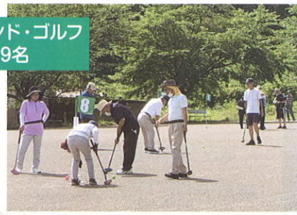
グラウンド・ゴルフ 参加者59名

こういったイベントが少しでも地域の活性化、個人においては、運動不足の解消、健康増進の一助となることを期待いたします。