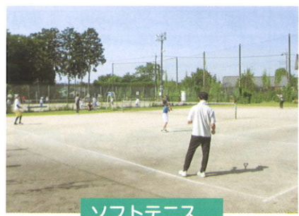
ソフトテニス 参加者約20名