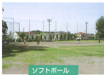
ソフトボール 参加 3チーム 約30名