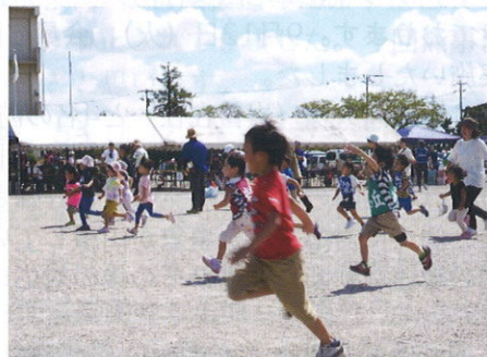
元気な子あつまれ