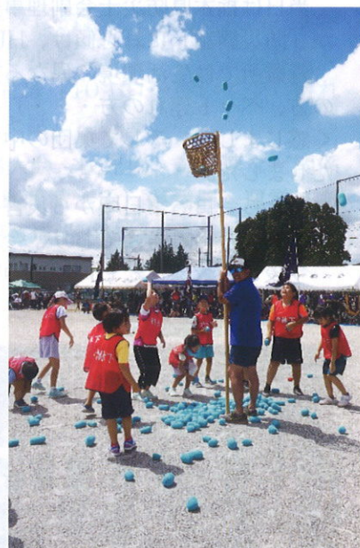
源平玉入れ 一つ、二つ・・・