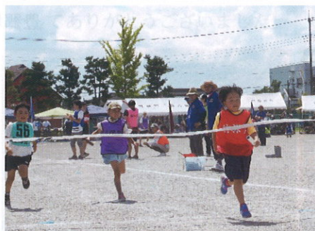
親子リレー、一着でゴールイン