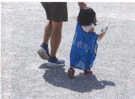
お菓子ゲットしたよ