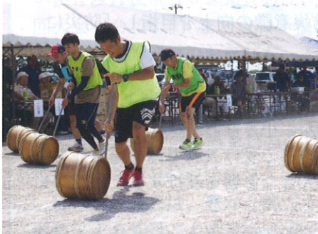
まっすぐに進まないよ！