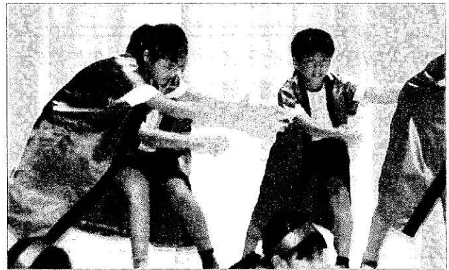
児童による力強い踊り「南中ソーラン」