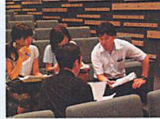
会話科・英語科部会